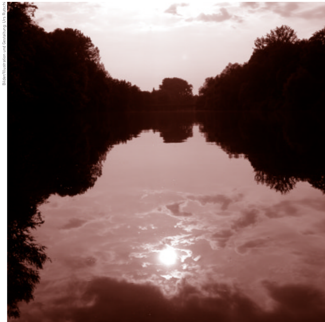
Bilder/Illustration und Gestaltung: Urs Rutsch

Legon Informatik Industriestr. 8 | CH-5722 Gränichen Tel. +41 62 842 00 28 | Fax +41 62 842 88 28 E-Mail: info@legon.ch | www.legon.ch